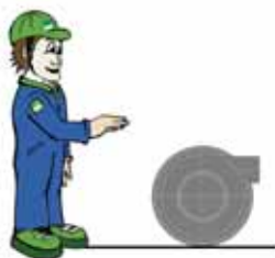
Fläkt CKV 75