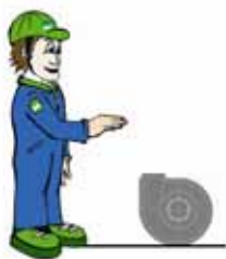
Fläkt CCV 75